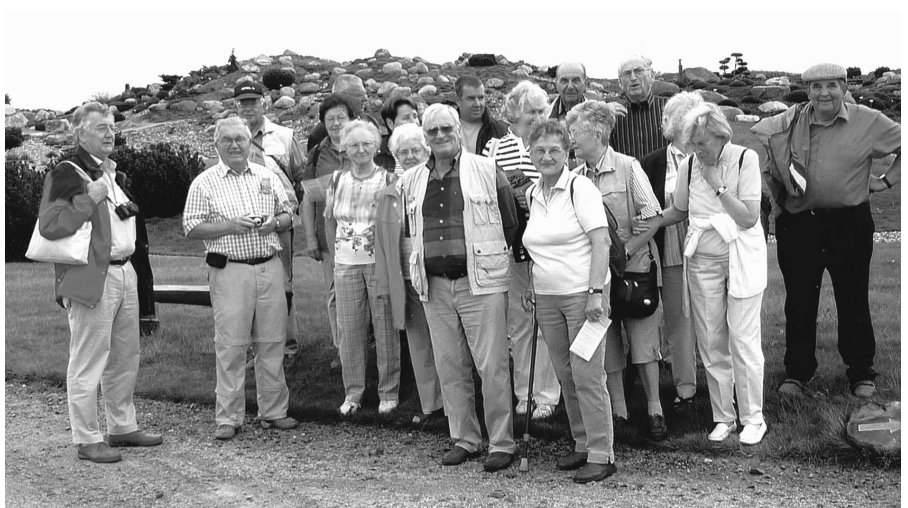
Die Mitglieder der Senioren-Union bei ihrer Reise in das Land der Sorben